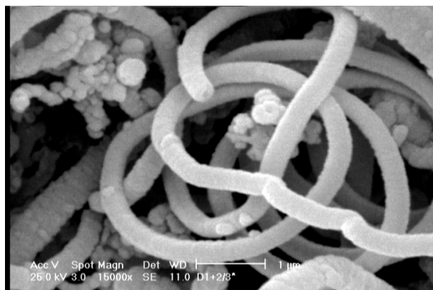
شکل ۱. نانولوله‌های کربنی که به روش CVD تهیه شده‌اند.

مشکل اساسی در استفاده از CNT برای آلاینده‌ها، مسئله ناپایداری شیمیایی CNT ها در دماهای بالا در واکنش با اکسیژن می‌باشد. از آنجایی که دمای رشد نانو تیوبها 550^\circ\text{C} است، دمای اعمال اکسیژن برای اکسیژن‌گیری نمونه‌ها از دمای 550^\circ\text{C} تا دمای اتاق انجام شد، تا از اکسیژن‌گیری کامل نمونه‌ها، اطمینان حاصل شود.