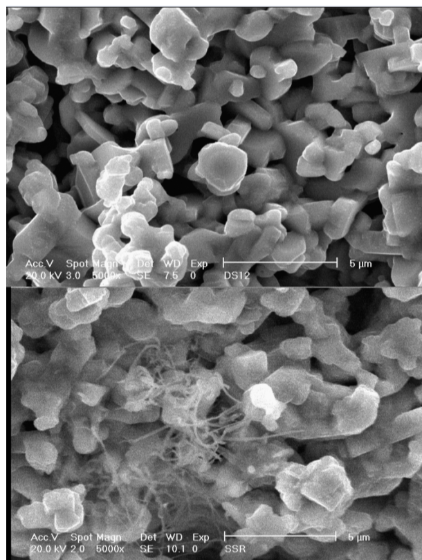
شکل ۴. تصاویر SEM نمونه‌های بدون آرایش (بالا) و با آرایش CNT (پایین).

نویسندگان از حمایت مالی معاونت پژوهشی دانشگاه الزهرا تشکر می‌کنند.