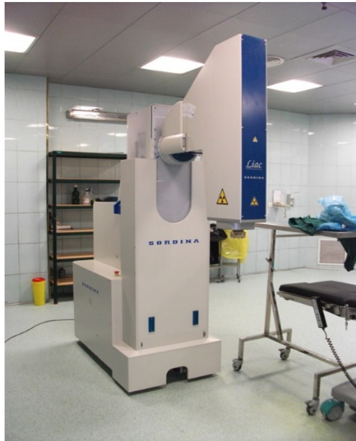
شکل ۱. نمایی از شتاب دهنده LIAC مورد استفاده در یک اتاق عمل استاندارد.

ساخته شده‌اند. لایهٔ تفلونی که دارای ضخامت بیشتری است، برای متوقف کردن باریکهٔ الکترون و لایهٔ استیل که از ضخامت کمتری برخوردار است، برای جذب تابش ترمزی حاصل از برهم‌کنش الکترون در لایهٔ تفلونی مورد استفاده می‌گیرد. قسمت استوانه‌ای شکل اپلیکاتور از جنس PMMA ۳ با ضخامت ۵ mm و طول ۲۵ cm ساخته شده است و تیغه‌های مذکور در بخش انتهایی آن واقع شده‌اند. ابعاد این اپلیکاتور برابر 210 \times 210 \times 250 mm ۳ می‌باشد و وزنی در حدود ۸٫۲ kg دارد. به دلیل وزن نسبتاً بالا این اپلیکاتور معمولاً توسط یک نگه‌دارنده به تخت جراحی ثابت می‌شود که علاوه بر نگهداری، دقت مکانی در حین درمان را نیز افزایش می‌دهد [۱۱]. نمایی از این اپلیکاتور در هنگام اتصال به سر شتاب دهنده اختصاصی LIAC در شکل ۲ نشان داده شده است.