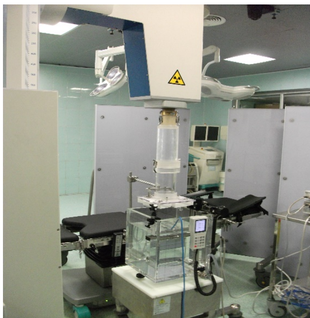
شکل ۲. نمایی از سر شتاب دهنده LIAC به همراه اپلیکاتور شکل دهنده باریکه متصل به آن.